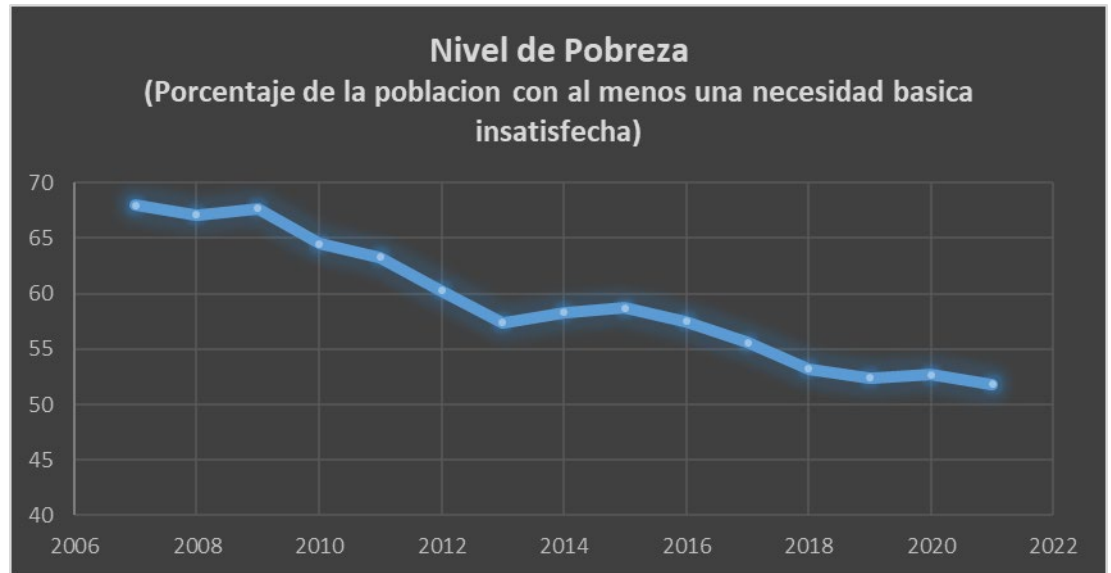
Imagen 2: Comportamiento de la variable Inversión Nivel de Pobreza del departamento de Loreto durante el periodo 2007 - 2021

es negativa y de -1.25 esto indica que la variable muestra valores relativamente menores a las de una distribución normal estándar típica.