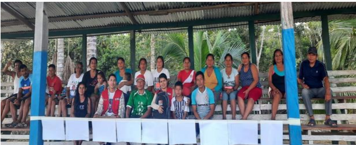
Foto 2: Grupos focales y participación de la comunidad de Nueva Fortuna sobre