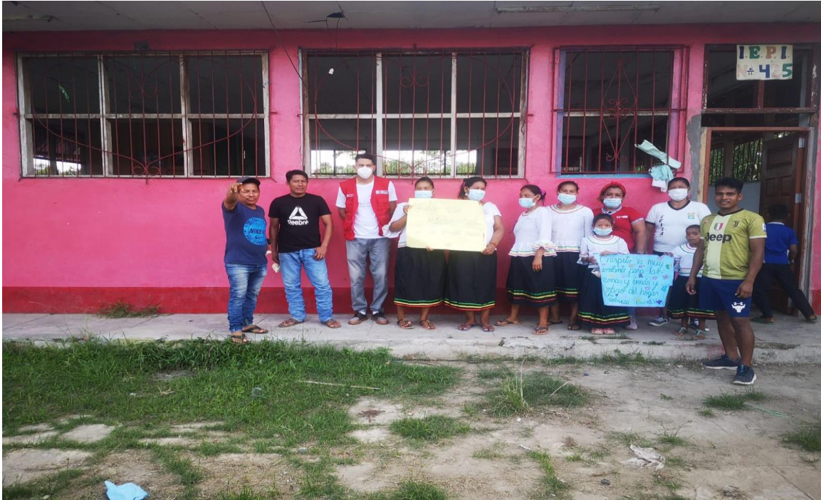
Foto 5: Talleres con las lideresas Kukama Kukamiria Nueva Fortuna