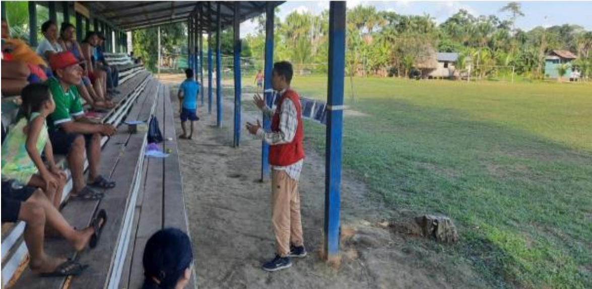
Foto 1: Sensibilización a la comunidad de Nueva Fortuna sobre la violencia de genero