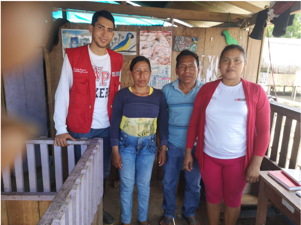
Foto 6: Informantes claves de la Comunidad Kukama Kukamiria Nueva Fortuna