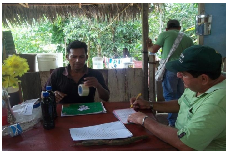
Foto 8. Huertos familiares en Gen Gen