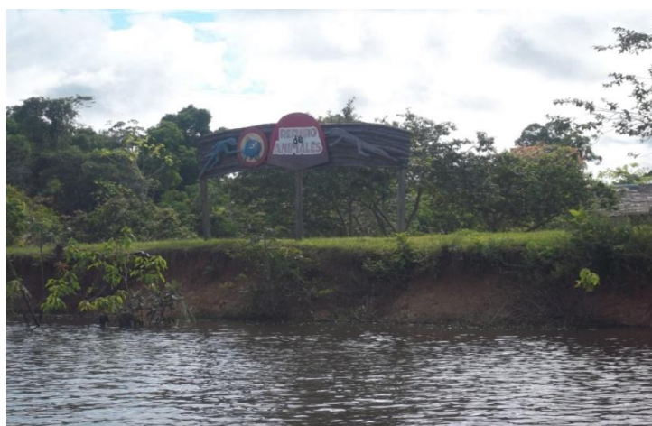
Foto 3. Lodge cercano a la comunidad de Gen Gen