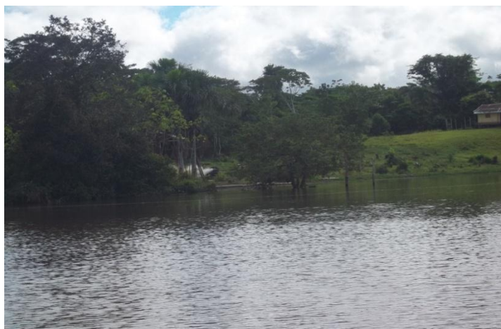
Foto 2. Sitios de visita en la cuenca del Momón cercano a las comunidades.