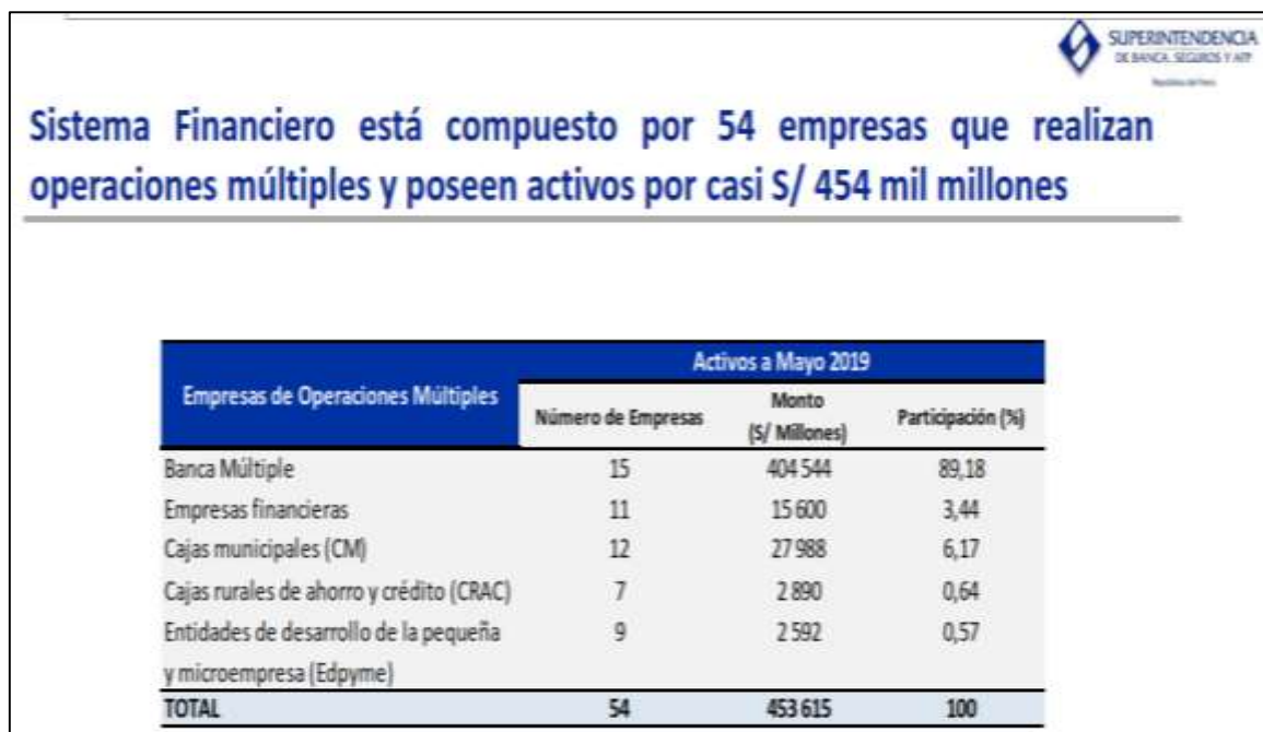
GRAFICO N° 02

Los intermediarios del mercado bancario (tales como los establecimientos bancarios) tienen por función principal captar recursos del sector superavitario, con el objeto primordial de realizar operaciones activas de crédito (otorgar préstamos al sector deficitario).