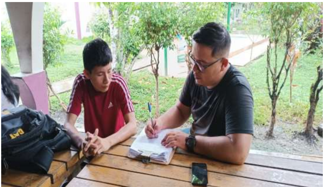
Foto 4: Entrevista a estudiante Achuar, 2023